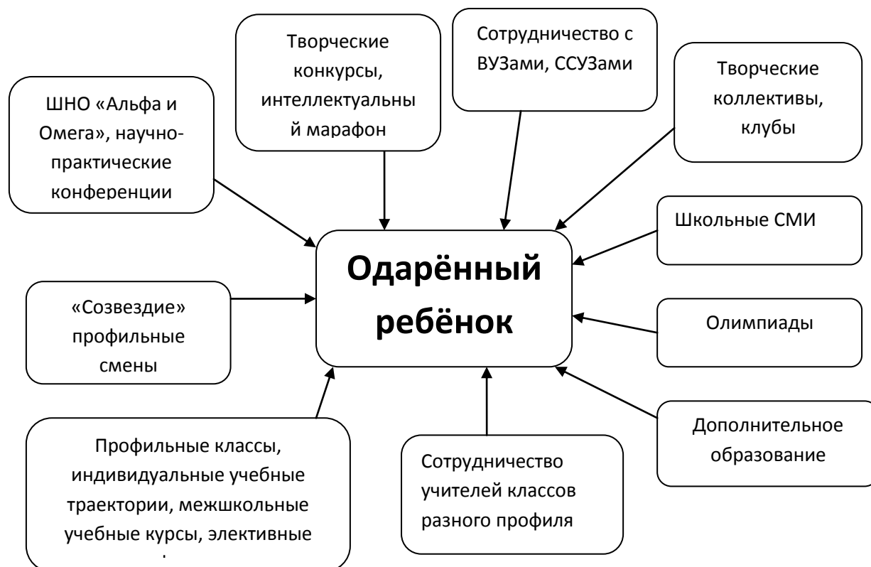
Схема сетевого взаимодействия МБОУ СОШ № 6 г. Амурска

Выявление, развитие и поддержка талантливых детей ведётся через следующие формы работы: